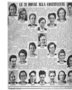
Tra i costituenti sono elette anche 21 donne