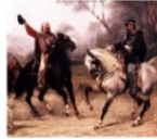
Torino: incontro tra Garibaldi e il re Vittorio Emanuele II