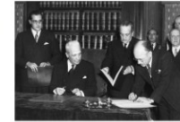
La firma della Costituzione