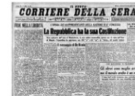
Pagina di giornale con annuncio della Costituzione