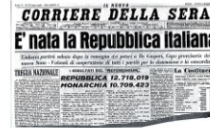
Pagina di giornale: al referendum vince la Repubblica