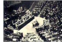
Lavori dell'Assemblea Costituente