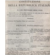
Prima pagina della Costituzione della Repubblica Italiana