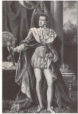
La Monarchia: re Carlo Alberto