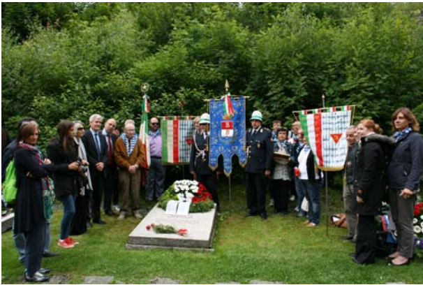
Delegazione italiana con il Console Generale d'Italia a Monaco.