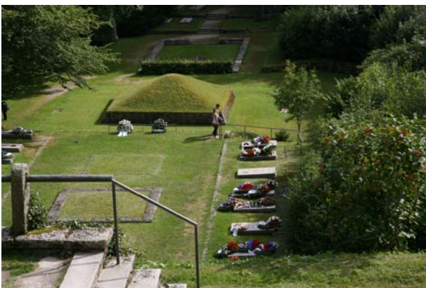
Veduta della "valle della morte" con le tombe delle varie nazioni.