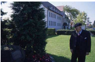
Hersbruck. Monumento commemorativo. Sullo sfondo l'edificio della Kommandantur