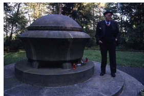
Hersbruck. Nel bosco uno dei Monumenti commemorativi nei luoghi delle pire.