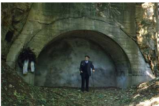
Hersbruck. Su per la montagna. Vic davanti ad uno degli ingressi murati delle gallerie