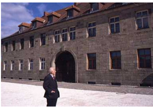
Lager di Flossenbürg: l'edificio della Kommandantur